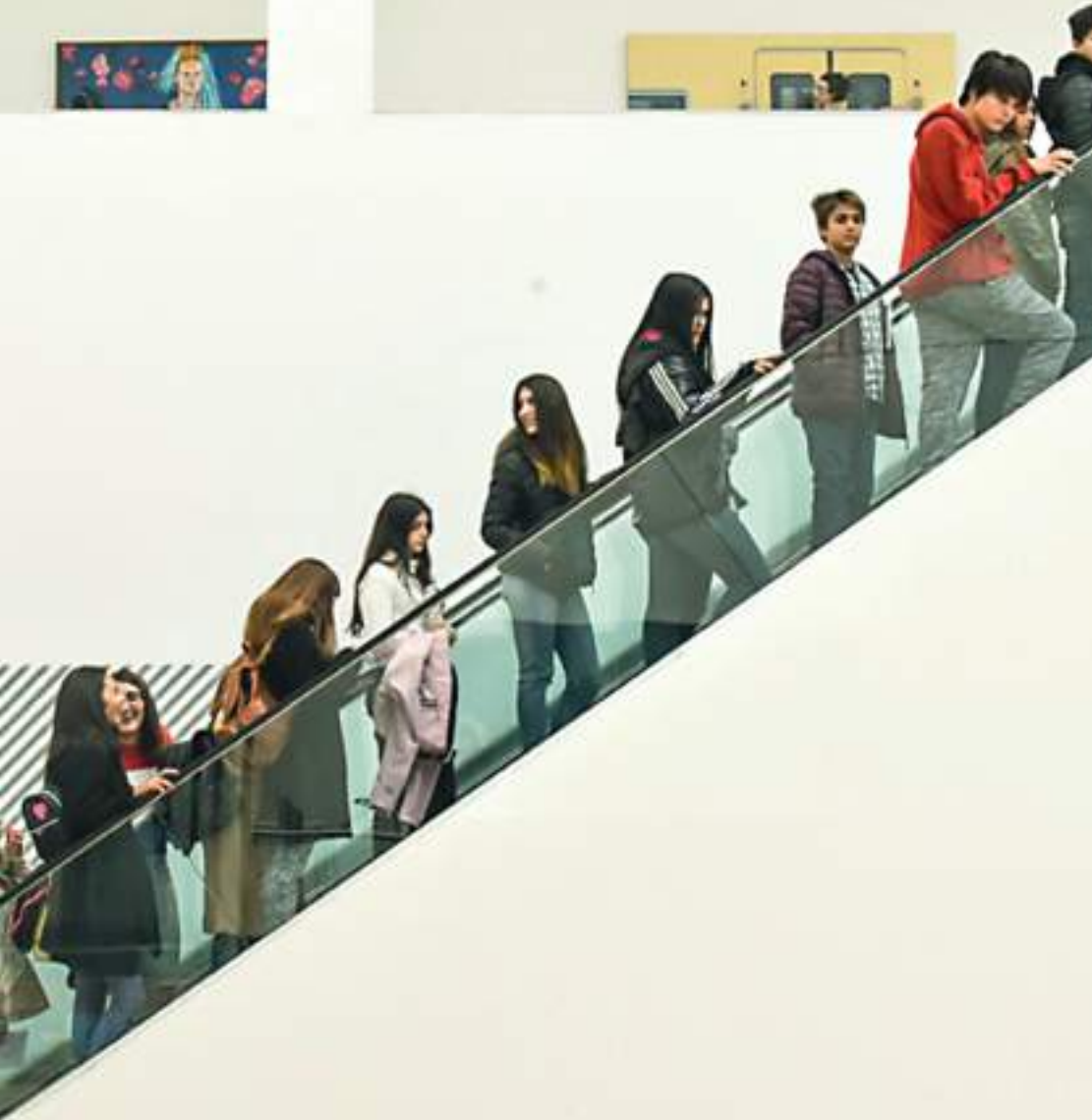
→ Leandro Erlich Liminal

Desde el área de Educación entendemos y pensamos al museo como un espacio creativo, experiencial y de creación de contenido colectivo. En 2010, se creó Malba Sub20 con el objetivo de enmarcar diferentes propuestas pensadas especialmente para adolescentes entre 13 y 20 años, con el fin de producir y compartir contenidos, acercarse a la creación contemporánea y entrar en contacto con artistas, instituciones artísticas y hacedores de la cultura.