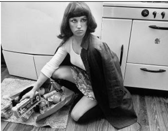
Cindy Sherman Untitled Film Still #10 , 1978 [Foto fija sin título N° 10] Copia en gelatina de plata 69,5 x 87 cm Colección Astrup Fearnley