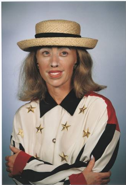
Cindy Sherman Untitled #402 , 2000 [Sin título N° 402] Impresión cromogénica 112 x 84 cm Colección Astrup Fearnley