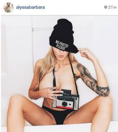
Richard Prince Untitled (Portrait) , 2014 [Sin título (Retrato)] Impresión de chorro de tinta sobre tela 167 x 123,8 cm Colección Astrup Fearnley