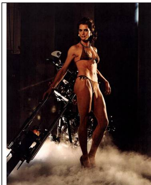
Richard Prince Spiritual America #4 , 2005 [América espiritual N° 4] Fotografía en Ektacolor 230 x 183 cm Colección Astrup Fearnley

Las imágenes se pueden descargar online de la web del museo: www.malba.org.ar/prensa Solicitar usuario y clave a sacampos@malba.org.ar