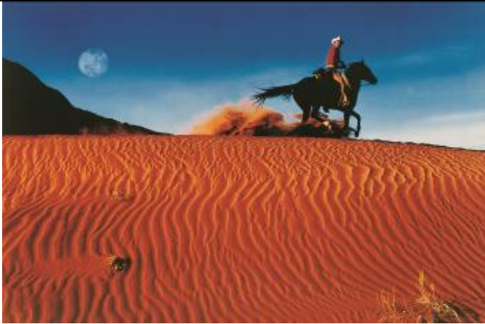
Richard Prince Untitled (Cowboy) , 1997 [Sin título (Cowboy)] Fotografía en Ektacolor 126 x 193 cm Colección Astrup Fearnley